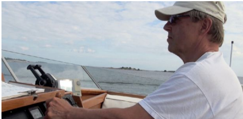
Hangon ja Maarianhaminan väliseltä alueelta löytyy maailman kaunein saaristo.

- Meri on kuin itse elämä. Sen olomuoto muuttuu eri olosuhteissa, mutta sisin on sama. Hienointa meressä on se, että se on. –a-ss.